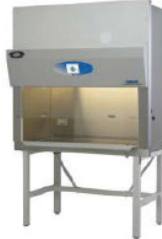
Tủ an toàn sinh học cấp II, Type A2+B1+B2