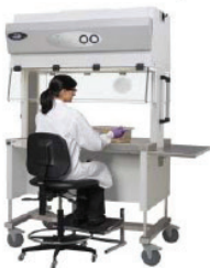
Trạm thao tác và chung chuyển động vật