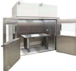
Phòng an toàn sinh học cấp II