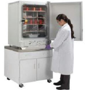
Tủ nuôi cấy CO2