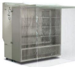
Phòng sạch cho động vật