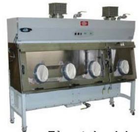
Tủ an toàn sinh học cấp III