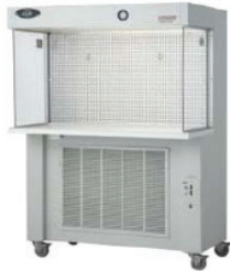
Tủ cấy ngang