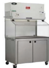
Tủ kiểm soát rác thải động vật

Giải pháp toàn diện cho nuôi cấy vi sinh, an toàn sinh học và bảo quản mẫu ứng dụng cho sản xuất và nghiên cứu trong các lĩnh vực: Công nghệ sinh học, thực phẩm, thú y, thủy sản, dược phẩm, vắc xin, bán dẫn, môi trường và cho tất cả các phòng lab.