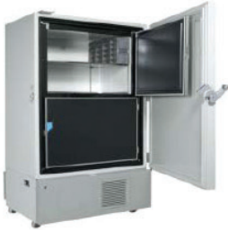
Tủ lạnh -860C