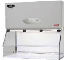
Tủ cấy đứng