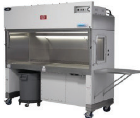
Tủ an toàn sinh học cấp II