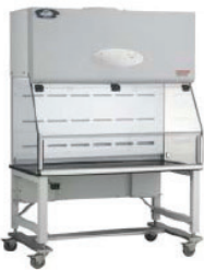
Tủ an toàn sinh học cấp I